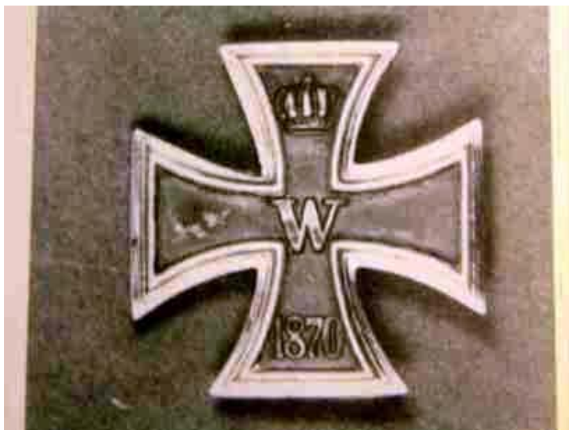
Ensimmäinen luokka 1870

Seuraavan kerran rautaristejä jaettiin vuonna 1870 Ranskan ja Preussin sodassa. Suurristejä jaettiin nyt kahdeksan kappaletta, ensimmäistä luokkaa noin 1 300 kappaletta ja toista luokkaa 41 770 kappaletta.