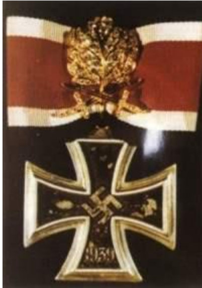
Ritariristi kultaisilla tammenlehvillä, miekoilla ja briljantein