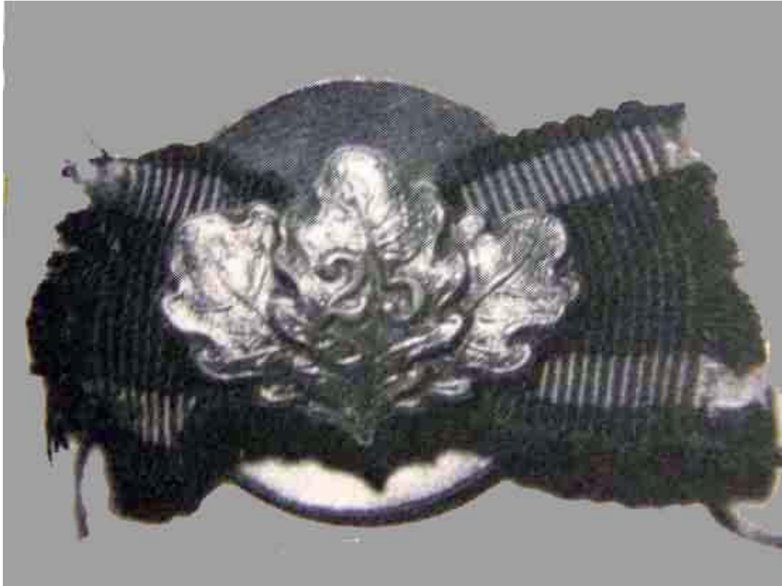
25-vuotissolki, jota jaettiin vuonna 1895 Käytettiin toisen luokan ristin nauhassa

Tällä vuosisadalla on kaksi periodia, jolloin rautaristejä on jaettu. Vuosien 1914 - 18 aikana jaettiin arviolta 1,5 - yli 5 miljoonaa kappaletta toisen luokan ristiä. Ensimmäisissä valmistetuissa risteissä on nauhan lenkissä hopealeima 800 tai 900. Toista luokkaa jaettiin noin 80000 - 250000 kpl monina variaatioina kiinnitystapojen osalta. Sodan loppuvaiheen materiaalipulan vuoksi valmistettiin risti kokonaan hopeasta ja yhdestä kappaleesta, kun se normaalisti puristettiin kolmesta kappaleesta. Suurristejä jaettiin viisi ja niistä yksi keisari Wilhelm II:lle.