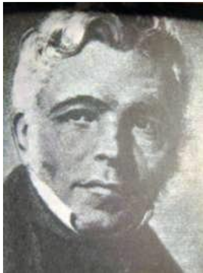
Rautaristin suunnittelija Karl Friedrich Schinkel

Rautaristin synty ulottuu vuoteen 1813, jolloin Preussi keisari Friedrich Wilhelm III:n johdolla julisti sodan Ranskalle 13.maaliskuuta. Ristin suunnitteli arkkitehti Karl Schinkel ja se vahvistettiin Preussin lehdistössä 20.maaliskuuta - näin yksi maailman tunnetuimmista kunniamerkeistä oli saanut alun. Alussa ristiä oli vain kolmea luokkaa: Grosskreuz eli Suurristi sekä ensimmäinen ja toinen luokka. Suurristi voitiin myöntää vanhemmille komentajille, jotka johtamisellaan pääsivät puolustuksessa tai hyökkäyksessä menestykseen. Ensimmäisen ja toisen luokan ristin saattoi saada henkilökohtaisesta urheudesta taistelussa arvoon katsomatta.