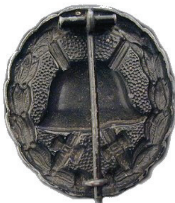
1. ms:n aikainen takaa

Kultainen merkki oli myös aina valettu messingistä. Pinta oli joko kiillotettua messinkiä tai joissain tapauksissa messinkivalun päälle tehtiin kultaus. Sodan loppupuolella merkin laatu heikkeni materiaalipulasta johtuen, jolloin merkien pinnat saattaa olla rokkoarpisia yms. Merkin sai viidestä tai useammasta haavoittumisesta, mutta kerralla oli tämäkin mahdollista saada, jolloin kyseessä oli täydellinen sokeus tai täydellinen invaliditeetti esim. halvaantuminen.