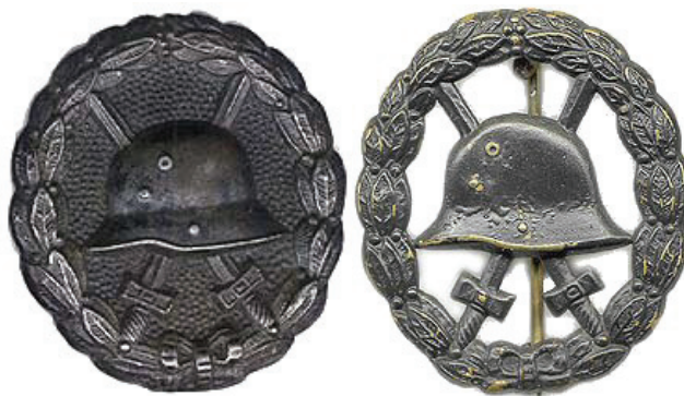
Mustat: normaali ja leikattu

2. maailmansodan alettua jaettiin Puolan retkellä vielä varhaisempaa ns. Espanjan merkkiä, kunnes vuoden