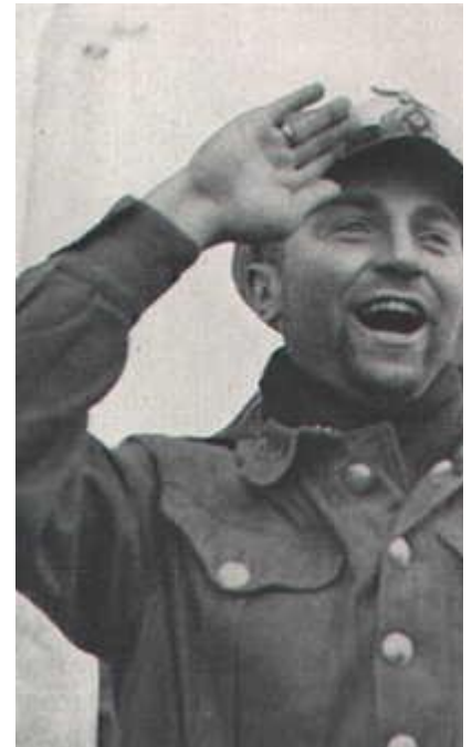
Prien tervehtii U-venettä taustallaan toinen U-veneässä Kretschmer .