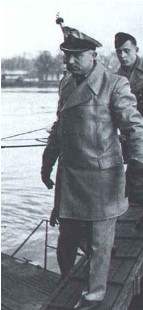
Prien nousemassa U-47:lle 20.1.1941, eli viimeiselle purjehdukselleen.